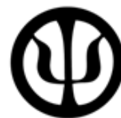
Colegio de Psicólogos de Honduras