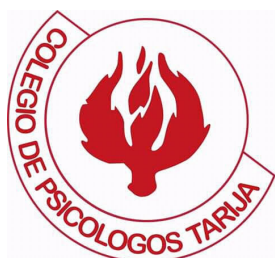
Colegio de Psicólogos de Tarija