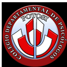
Colegio Departamental Psicólogos Potosi