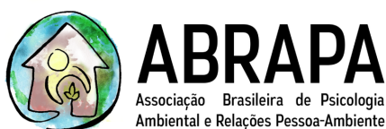
Associação Brasileira de Psicologia Ambiental e Relações Pessoa-Ambiente