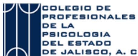
Colegio de Profesionales de la Psicología del Estado de Jalisco, A. C.

Organizations that endorse the Declaration